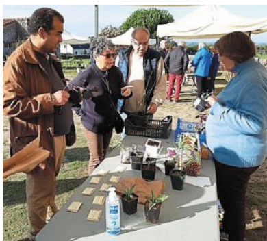
À la ferme des Coteaux, premier troc aux plantes de l'Animation florentaise.

Pour l'Animation florentaise, cette opération, comme l'exposition estivale, rejoint le souhait communal de redonner vie et dynamisme à cet espace, propriété de tous.