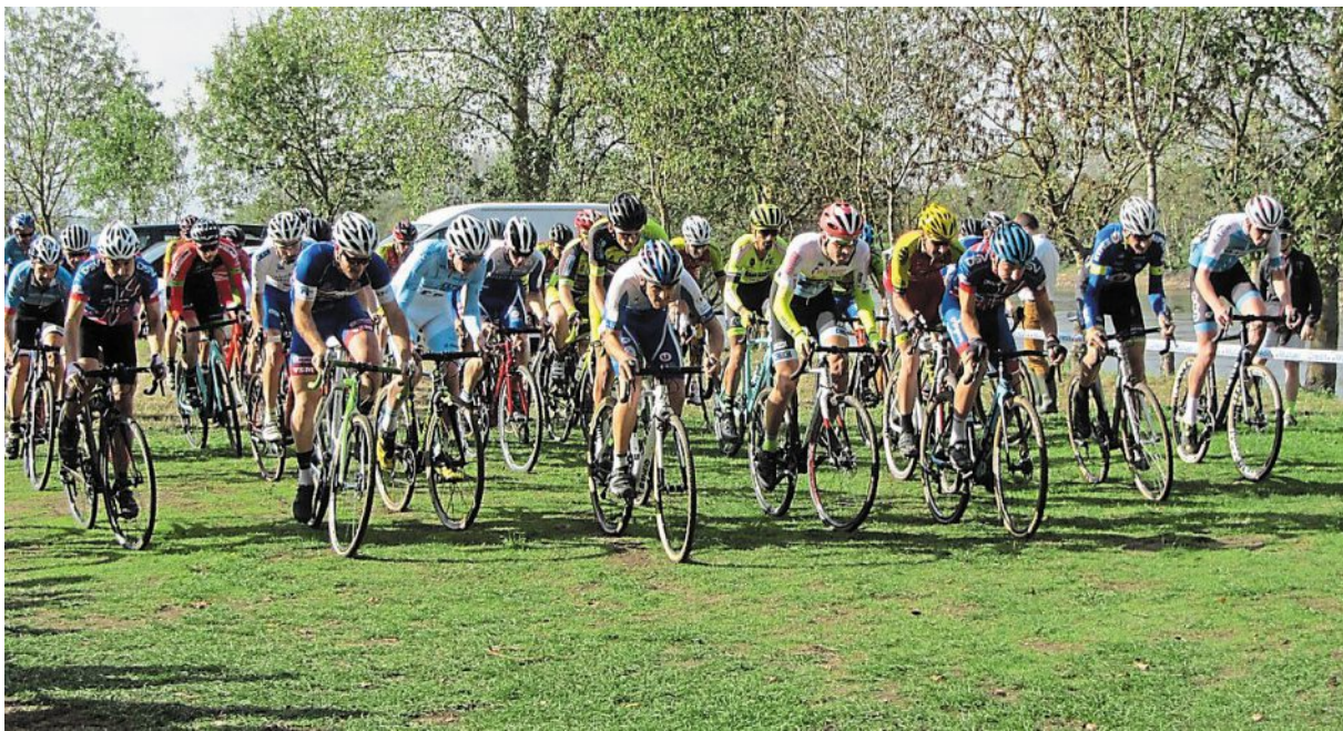
Le cyclo-cross du Rayon florentais au site de la Carrière, une épreuve régionale bien cotée qui fait venir un nombreux public.

Samedi, ils seront une trentaine de bénévoles, tous membres du Rayon florentais, à apporter leur contribution