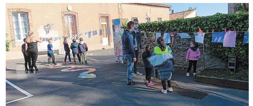
Le vent a fait voler les feuilles tout au long de la journée !