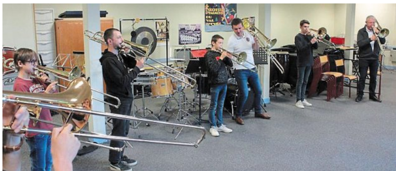
Venus des écoles de musique du département, une dizaine d'instrumentistes ont profité des conseils de quatre trombonistes venus des Hauts-de-France, samedi à l'École de musique du Val-d'Èvre. Une restitution était programmée le soir, en première partie du concert du quatuor Qu4treA4.