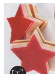
Pom ' pin forestière